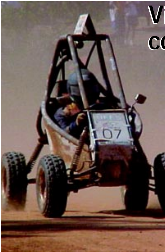
EM BREVE OS CARROS DA EQUIPE VITÓRIA BAJA PRODERÃO TREINAR DENTRO DO CAMPUS DE GOIABEIRAS