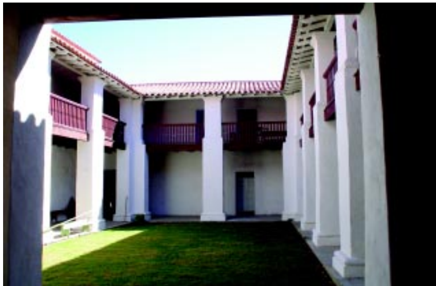
A RESIDÊNCIA ANEXA TEVE SUA CONFIGURAÇÃO ORIGINAL RESGATADA COM RETIRADA DE MURETAS QUE CERCAVAM O CENTRO DO PÁTIO E COM REPLANTIO DA GRAMA

Sétima etapa: A última etapa foi a do tratamento interpretativo desse patrimônio, com informações reunidas nas pesquisas históricas e nas prospecções arqueológicas e arquitetônicas.