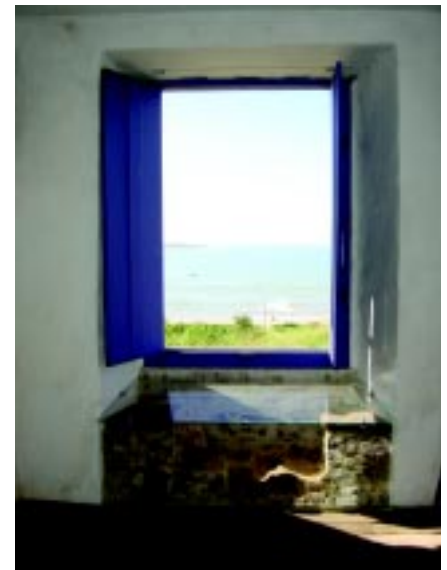
A PESQUISA ARQUEOLÓGICA IDENTIFICOU OUTRAS FORMAS DE USO E FASES DE REFORMAS ANTERIORES. COMO EXEMPLO, A JANELA CONVERSADEIRA QUE UM DIA JÁ TEVE GRADES QUANDO A SALA ERA UMA CELA.

de outra forma não seriam descobertos. Além de elementos arquitetônicos, que podem ou não ser recuperados pela restauração, há a construção do conhecimento sobre o surgimento desse assentamento humano e sua evolução através do tempo, o que é fundamental para a compreensão de sua história”.